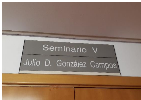
Seminario permanente en su nombre, en la UAM

A sus discípulos nos inculcó la honradez y la objetividad en el manejo de las fuentes, con el único objetivo de la calidad científica, por encima de las divisiones en escuelas. Nos formó en el esfuerzo intelectual, la dedicación y la disciplina académica.