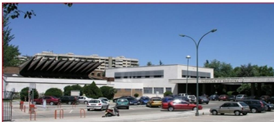
Facultad de Medicina de la UAM

Pero para poner en marcha la Facultad hubo que hacer un gran esfuerzo, ya que a las dificultades iniciales de falta de locales propios se unía el deseo de ir sentando principios firmes en su funcionamiento a través de un plan de estudios completamente distinto al vigente en las demás Facultades. En 1970, en terrenos pertenecientes al Ministerio de Educación y Ciencia, próximos al Hospital La Paz pudo construirse el edificio de Departamentos básicos de la Facultad, con sus aulas correspondientes, así como el edificio del Decanato, oficinas administrativas y el Aula Magna (hoy denominada Aula Magna José María Segovia de Arana tras el acto-homenaje realizado el 14 de marzo de 2016).